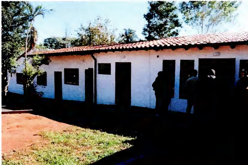
Imagen 4. Habitación con mobiliarios para cada usuario.